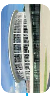
Lilliad - Learning center innovation