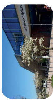
Méto cité scientifique Pr Gabillard

Département Sciences de l'éducation et de la formation des adultes (bât. B6)